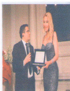
L'attrice e produttrice Valeria Marini