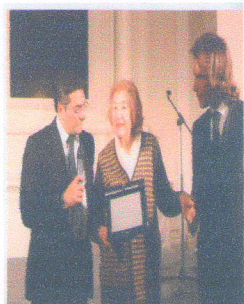
La Poetessa Maria Luisa Spaziani