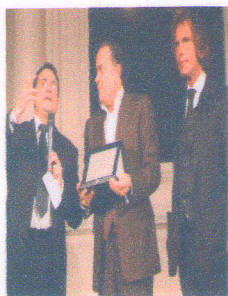
Il Cantante Gianni Nazzaro