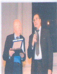
Lo storico ex Ministro e Sindaco di Roma Clelio Darida