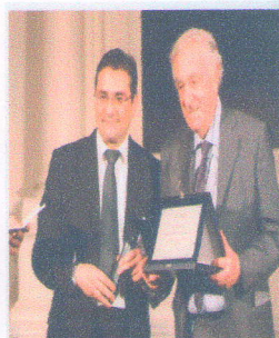
Il luminaire ortopedico Vincenzo Monti